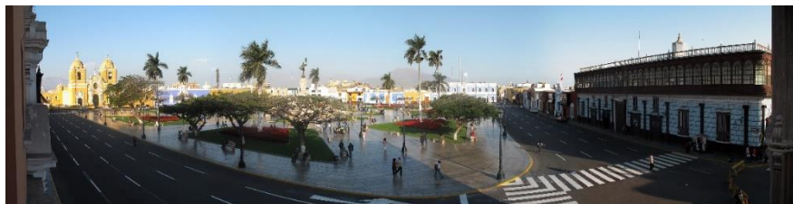
Figura 3. El centro de El Domo.