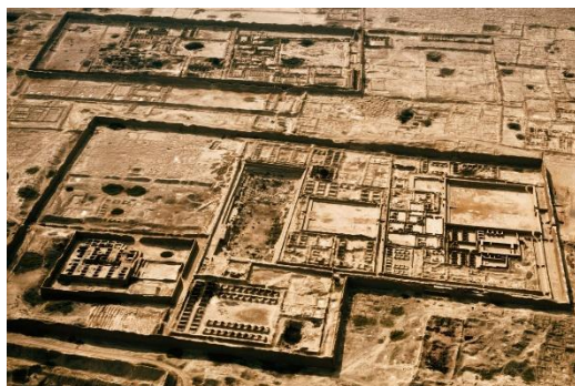
Figura 1. Ciudadela Chan Chan.

ciudadelas de barro que se asientan en casi cuatrocientos ochenta y cuatro hectáreas, y que hasta la fecha resisten al tiempo: Chan Chan, la gran capital de barro del poderoso reino Chimú , título sugerido por Carme Mayans en documental hecho por la National Geographic , en enero del 2013.