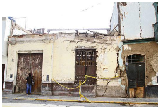
Figura 4. Muerte de los monumentos.

Ver como los balcones, pórticos, techos y muros van cediendo al tiempo no es más que un mensaje de un signo sin signo, que expresa la pragmática del usuario. Dejar caer el telón por la madrugada es la mejor salida, mojar las bases de adobe para tumbar los muros es la técnica usual en algunos monumentos estáticos del Centro Histórico de Trujillo.